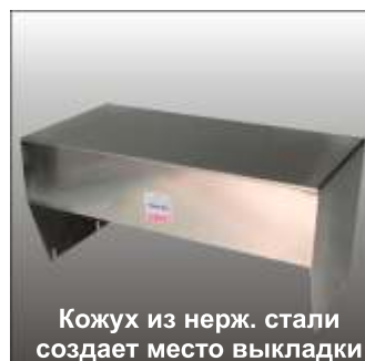
Кожух из нерж. стали создает место выкладки