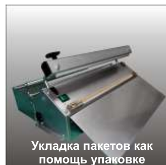
Укладка пакетов как помощь упаковке