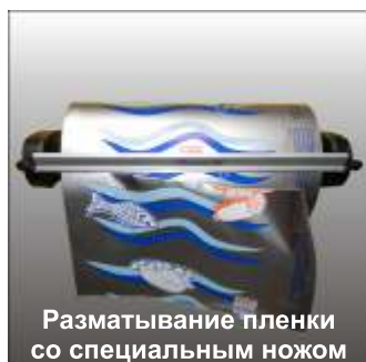
Разматывание пленки со специальным ножом

FS-Comfort находит место в самых маленьких лавках-прицепах. Благодаря небольшой высоте FS-Comfort вместе с рулоном можно расположить на прилавке и покупатель может наблюдать за процессом.