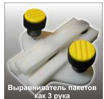
Выравниватель пакетов как 3 руки

Технические изменения возможны. Детальные технические данные Вы найдете в паспорте машины и диаграмме энергии