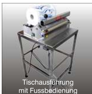
Tischausführung mit Fussbedienung