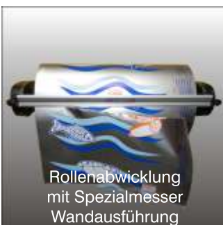
Rollenabwicklung mit Spezialmesser Wandausführung

FS-Comfort findet noch im kleinsten Verkaufshänger Platz. Durch die geringe Bauhöhe kann sogar FS-Comfort mit Rollenabwicklung auf der Verkaufstheke platziert werden- und der Kunde hat weiterhin Blickkontakt.