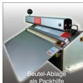
Beutel-Ablage als Packhilfe