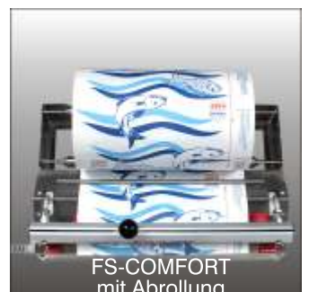
FS-COMFORT mit Abrollung

Technische Änderungen vorbehalten. Detaillierte technische Angaben finden Sie im Maschinen-Passport und Energie-Diagramm